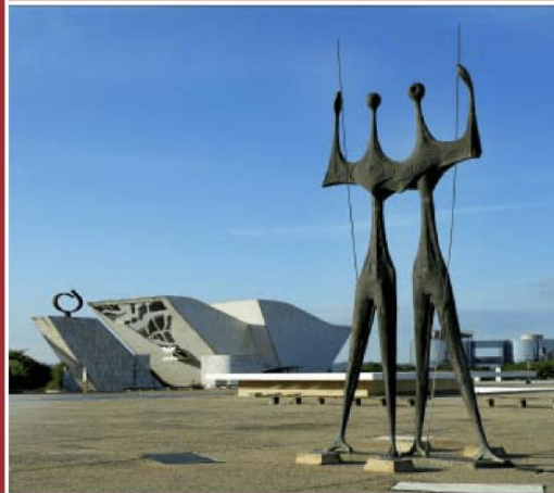
Praça dos Três Poderes, Brasília - DF